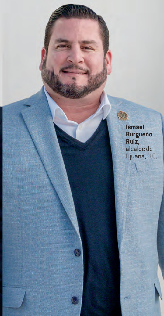
Ismael Burgueño Ruiz, alcalde de Tijuana, B.C.